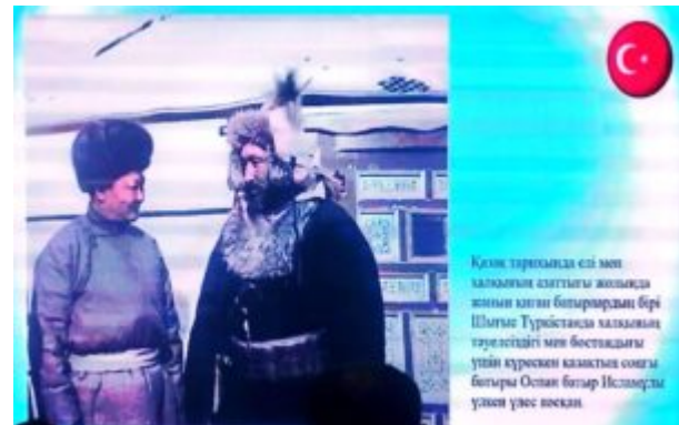
Қазан тарихында екі мән қалыпқан азаттығы жолында жанын қатіп бітірардың бірі Шығыс Түркістанда қалыпқан тәуелсіздігі мен бостандығы үшін күрескен қазақтар соңғы бағыры Осман бағар Исламды ұстап үлес көскен